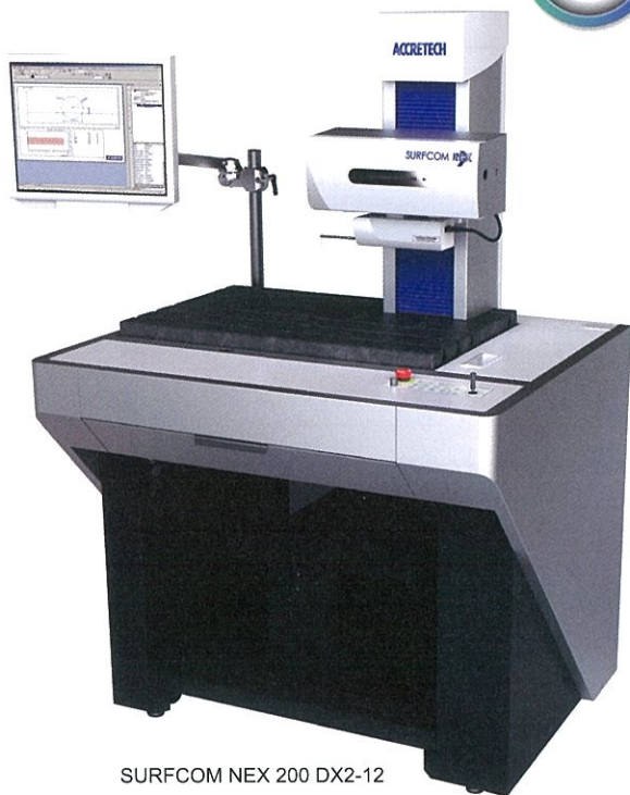
SURFCOM NEX 200 DX2-12