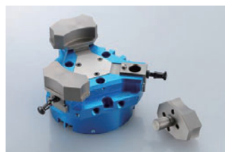
クイックジョーチェンジ