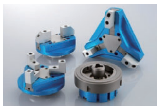
クイックプレートチェンジ